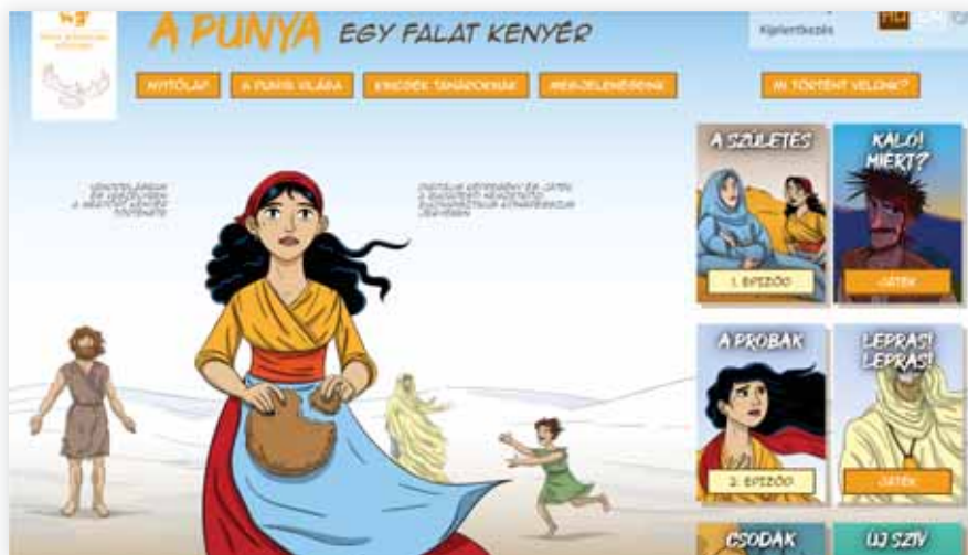
1. A digitális képregény nyitóoldala

Felmerülhet bennünk a kérdés: miként lehetne az evangéliumi üzenetet ebben a korban közel hozni a mai fiatalok számára? Hogyan segíthetnénk elő pedagógiai eszközök által, hogy mi magunk is részesei legyünk Jézus élettörténetének? Miként tudna ebben segítségünkre és hasznunkra lenni a digitális kultúra és a jelen kommunikációs kultúra? Az elmúlt félv járványtapasztalata után pedig már kikerülhetetlen a kérdés: miben kell fejlődünk, mit kell elsajátítanunk ahhoz, hogy online is képesek legyünk minőségi módon kapcsolódni egymáshoz? Hogyan tudunk hatékony nevelő és oktató tevékenységet folytatni, abban az esetben, ha a körülmények nem engedik meg a személyes találkozást?