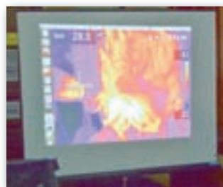
Hőkamerás felvétel egy hajszáritóval melegített frizuráról

Szintén több mint százéves szertári darab a Lissajous-görbék (a fotón a kis papíron kirajzolódó görbék) előállítására alkalmas szerkezet. A nagy fogaskerék forgatásával 2 különböző átmérőjű fogaskerék-áttétellel elérhető, hogy a táblácskát tartó rúd és a filctollat tartó rúd egymásra merőleges harmonikus rezgéseket végezzen, különböző frekvenciával. A papíron a merőleges rezgések egymáratevődése rajzolódik ki, tehát az, ahogyan a filctoll nem az asztalhoz, hanem a táblácskához képest mozog.