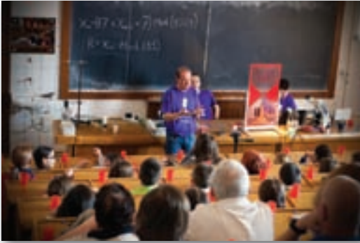
A véletlenszerűség és/vagy kiszámíthatóság világába kalauzoló előadás

lák segítségével), pörgettyűkkel kapcsolatos jelenségek és a folyadékok áramlásával kapcsolatosan a Bernoulli- és a Magnus-hatás (amely magyarázza, hogy hogyan lehet a futballban „kiflit” rúgni). A másik előadáson Néda Zoltán professzor a véletlenszerűség és/vagy kiszámíthatóság világába kalauzolta el a közönséget. Itt számos más interaktív kísérlet mellett mindenki dobókockát kapott, és aktívan részt vett „véletlenszám” generálásában. Önálló kísérletek alapján a közönség megértette a véletlenszerű, a kiszámítható és a kaotikus jelenségek közti különbségeket. A véletlen és kaotikus folyamatok esetén statisztikus törvényszerűségeket fedezhettek fel egy Galton-táblán a Brown-mozgásban a mágneses kaotikus ingára, illetve a kozmikus gamma sugárra vonatkozóan.