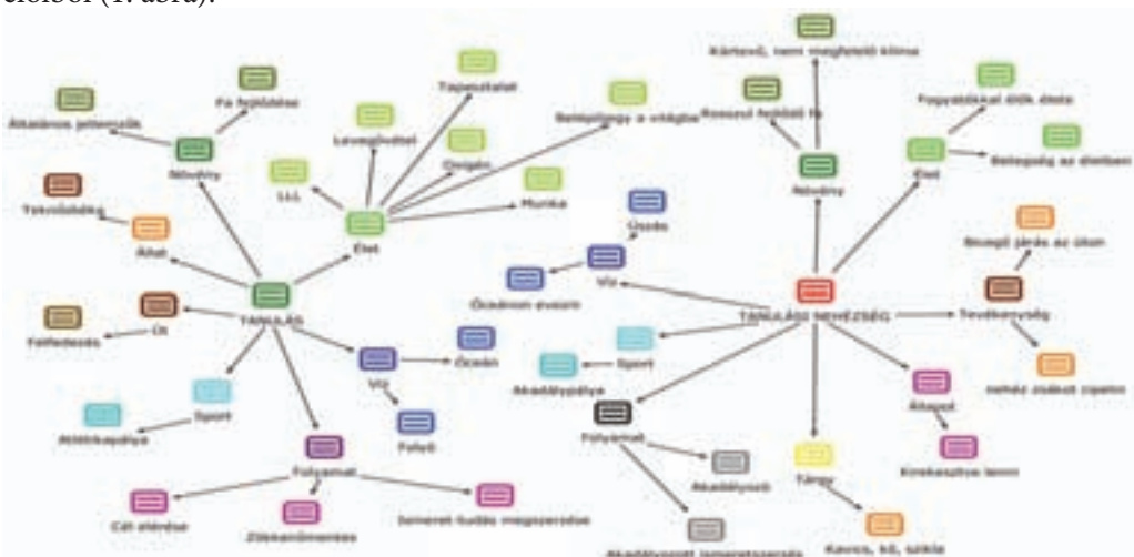
1. ábra: A tanulás és a tanulási nehézség fogalmak metaforahálója

Az eredmények értelmezéséhez – a vizualizációt is elősegítve – induljunk ki a MAXQDA MAXMaps segítségével készített metaforaháló, valamint a szöveges indoklások információiból (1. ábra):