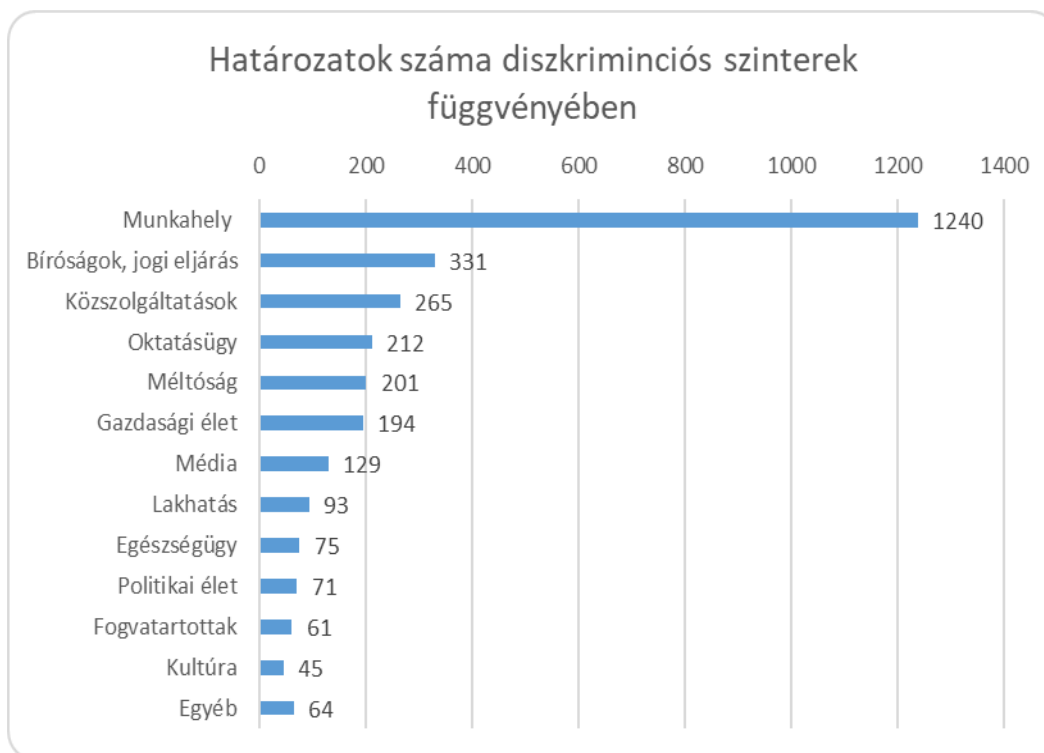
1. ábra. a Diszkriminációellenes Tanács által kibocsátott határozatok száma adott diszkriminációs szintéren

Az 1. számú grafikon alapján láthatjuk, hogy a legjelentősebb diszkriminációs szintér az a munkaügy területe, legalábbis ezen a területen történt a vélt vagy valós hátrányos megkülönböztetések 41%-a.