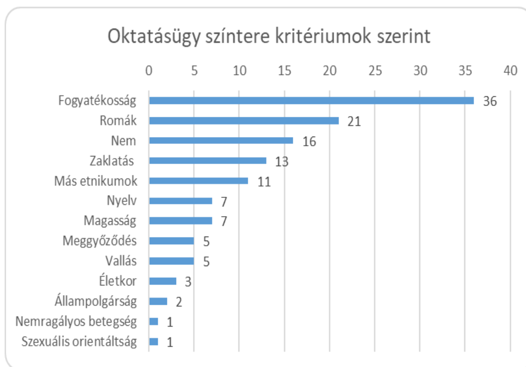
2. ábra. Az oktatásügy szintere a hátrányos megkülönböztetés kritériumai szerint, a Diszkriminációellenes Tanács határozatai alapján