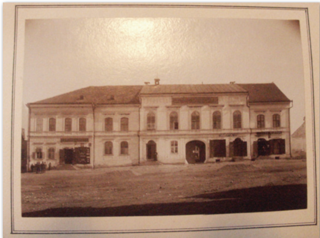
A gyergyóditrói központi elemi és polgári iskola épülete