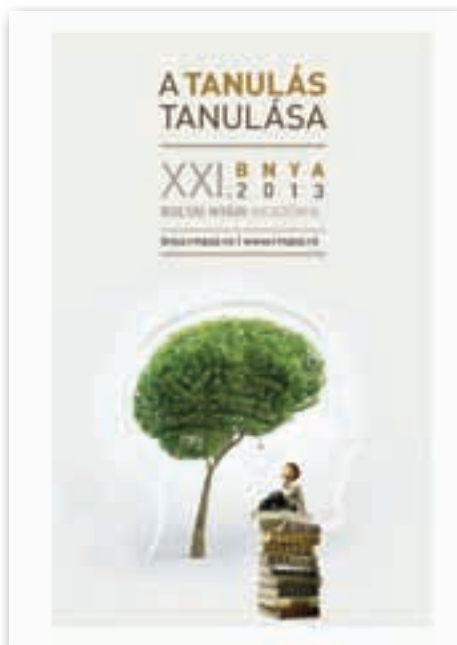
2. kép A 2013-as BNYA plakátja

A téma lényegét egy-egy rövid idézet foglalta össze, amely felkerült a plakátokra és a hallgatók ajándékmappájára is.